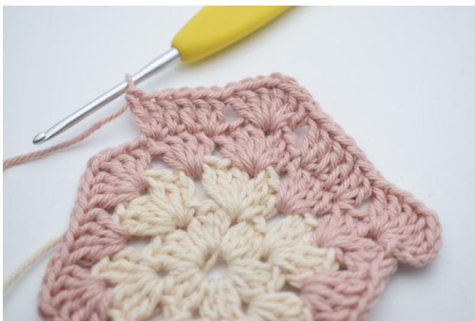
9. sla 3 steken over, haak 2 Stk in de volgende steek, 1 Stk in de volgende 2 steken, 2 Stk in de volgende steek*.