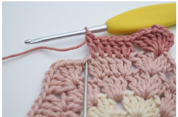
6. Haak 2 Stk in de volgende steek.