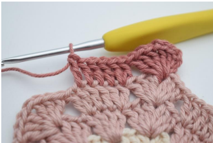
5. Haak 1 Stk in de volgende 4 steken.