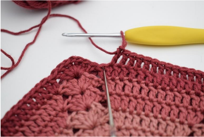
7. 2 Stk in de volgende steek.