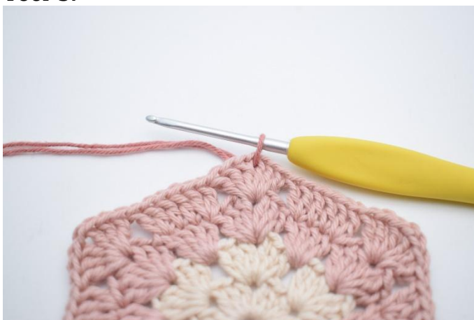
1. Wissel naar kleur 3. Hecht aan in een losserruimte.