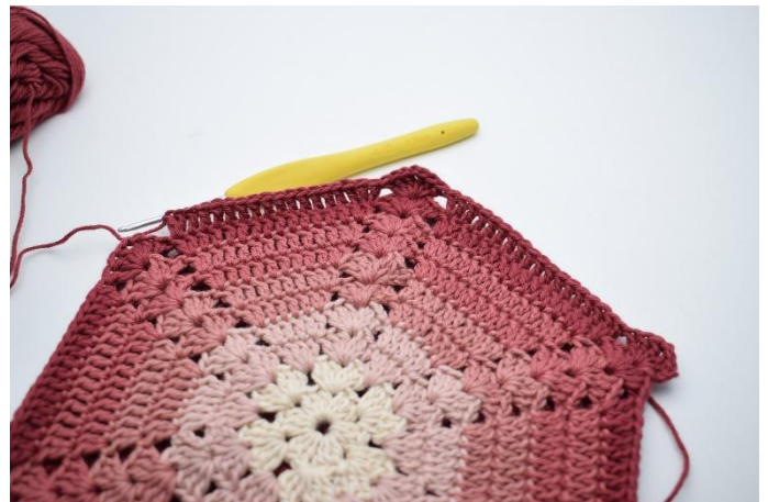
10. Sla 3 steken over, haak 2 Stk in de volgende steek, 1 Stk in de volgende 14 steken, 2 Stk in de volgende steek*.