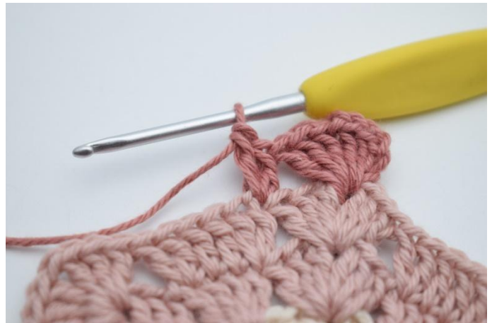
4. haak 2 Stk in de volgende steek.