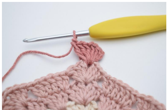
2. Haak 3 L. Haak 2 Stk, 1 L, 3 Stk om de losse.