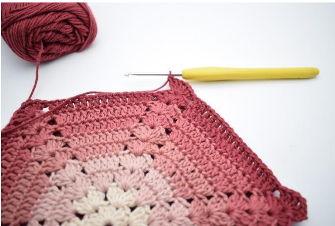
9. Haak 3 Stk, 1 L, 3 Stk om de losse.