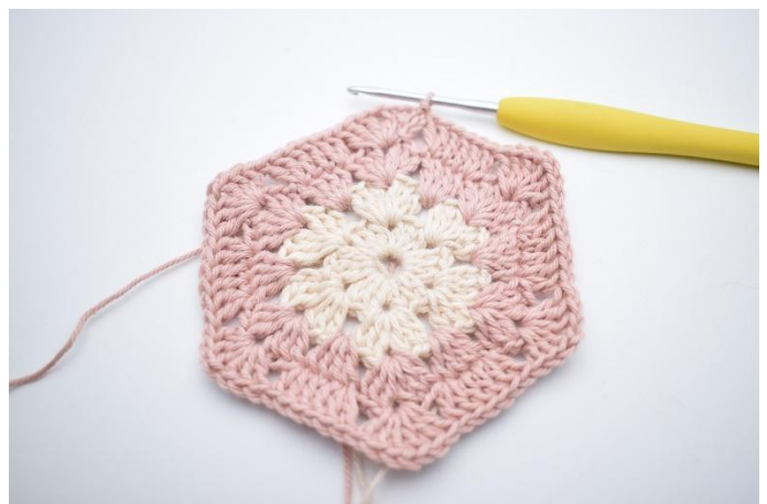
10. Herhaal *tot* in totaal 5x. Sluit met 1 Hv. Knip het garen af.