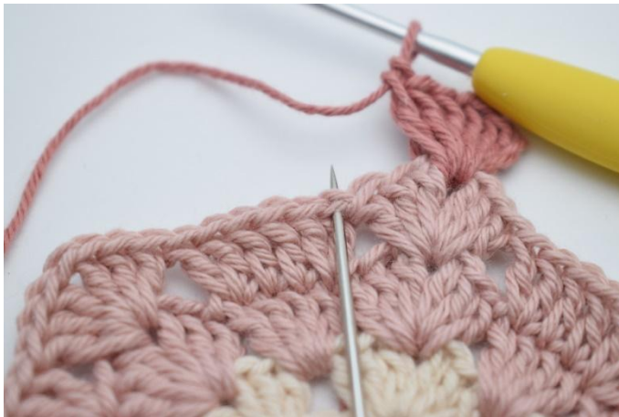
3. Sla 3 steken over,