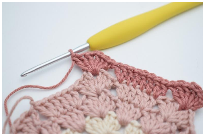
8. *Haak 3 Stk, 1 L, 3 Stk om de volgende losse,