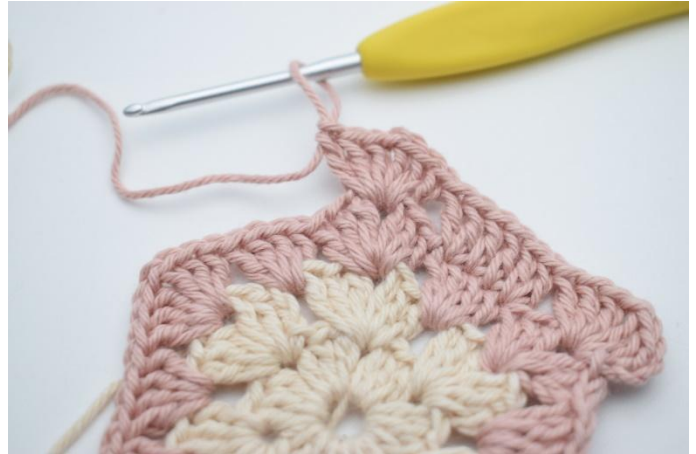
8. *Haak 3 Stk, 1 L, 3 Stk om de volgende losse,